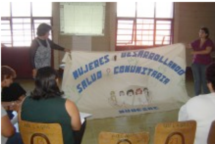
Projektåret i Costa Rica lider mot sitt slut.

Motgångar har mötts, beslut tagits och kvinnorna i LIMPAL Costa Rica har lyckats genomföra ytterligare ett för många kvinnor stärkande projektår.